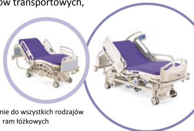
Odpowiednie do wszystkich rodzajów ram łóżkowych

Seria produktów wysokiej jakości, wykonanych z polimerów wiskozowo-elastycznych obejmuje: materace, nakładki na materace, materace do wózków transportowych, poduszki siedzeniowe i podkładki pod nogi.